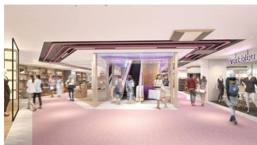
共用部リニューアル イメージ