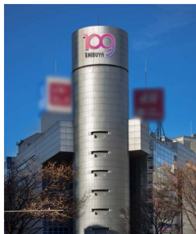
設置予定イメージ