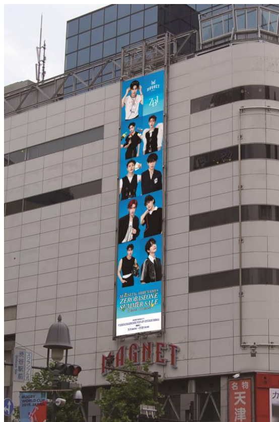
MAGNET by SHIBUYA109装飾イメージ