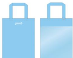
FRONT BACK