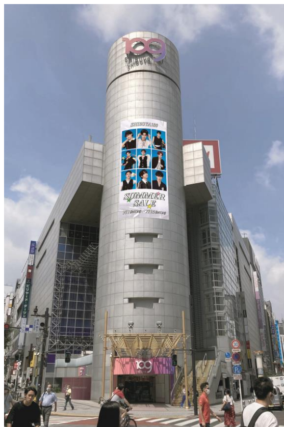
SHIBUYA109渋谷店装飾イメージ

さらに、「ZEROBASEONE」メンバーのオリジナルコメント動画がSHIBUYA109渋谷店・阿倍野店の館内にてご覧いただけます。