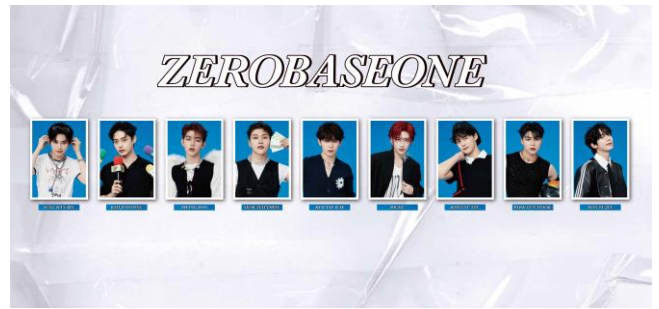
フотスポット壁面イメージ（一部）