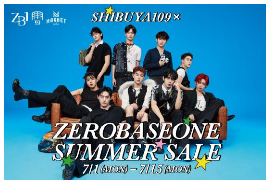
ポストカードイメージ

※POP-UP STORE『ZEROBASEONE POP-UP STORE 2024』、一部店舗でのお買い物は対象外となります。