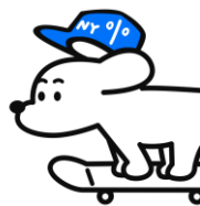
SHIBACHAN イラストレーター、NFTクリエイター