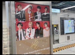
地下鉄ポスターボード (大阪地下鉄御堂筋線/谷町線駅)