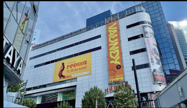
大型懸垂幕・ウォールジャック (MAGNET by SHIBUYA109)