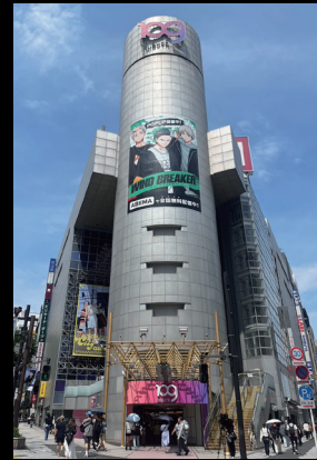
シリンダー・店頭イベントスペース (SHIBUYA109渋谷店)