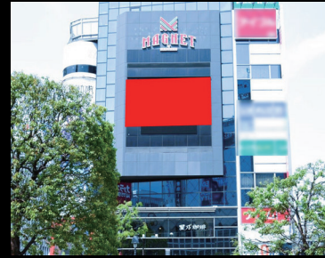
フォーラムビジョン (MAGNET by SHIBUYA109)