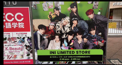
あべの歩道橋看板 (JR天王寺駅・あべのハルカス・天王寺MIO等を繋ぐ歩道橋内)