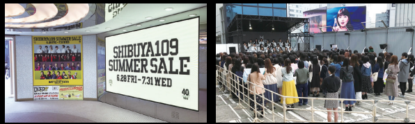
大型サイネージ (SHIBUYA109エントランス)