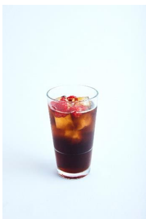
ショコラ エディ ラブ 600円