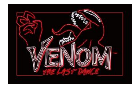
オリジナルステッカーイメージ