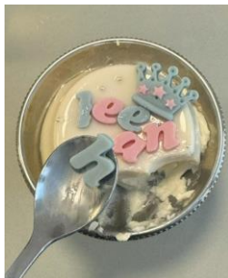
【カスタムパンナコッタ】