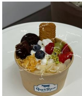
【フローズンヨーグルト】