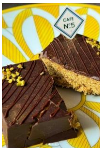
【ドバイチョコレート】