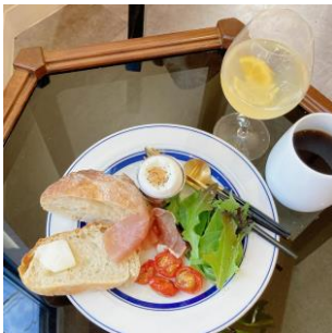
【モーニングカフェ】