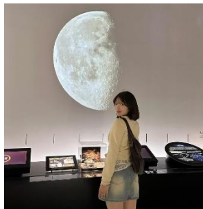
【レトロフューチャーコア】