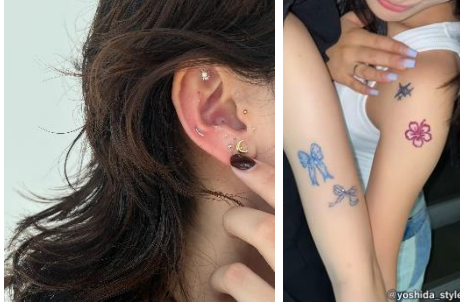
【耳つぼジュエリー・ボディジュエリー】