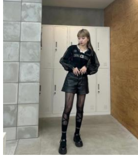
【レースアップ靴下】