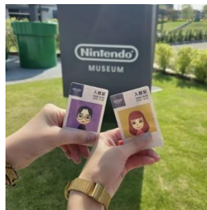
【ニンテンドーミュージアム】