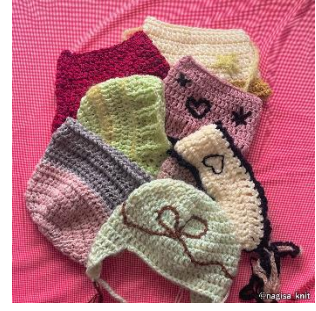
【かぎ編みニット帽】