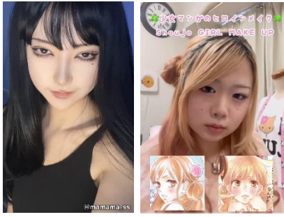
【平成アニメ・漫画メイク】